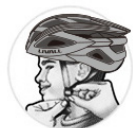
调节好拉带的长度

头盔必须紧密地贴紧头部。若要调低安全头盔前部以覆盖前额，可将该拉带紧贴下巴并调松后拉带；若要将安全头盔前部调高，可调松该拉带并拉紧后拉带。